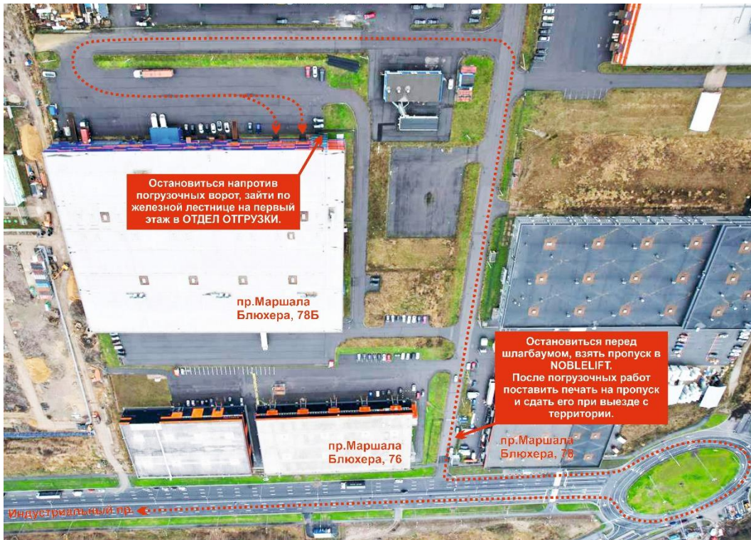
Схема движения по территории: